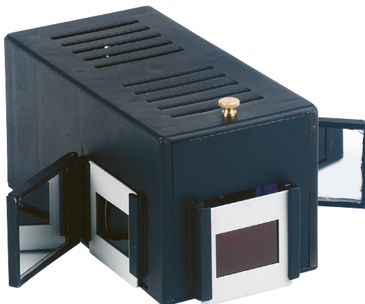
Fig. 7 : Montage en configuration source à miroirs