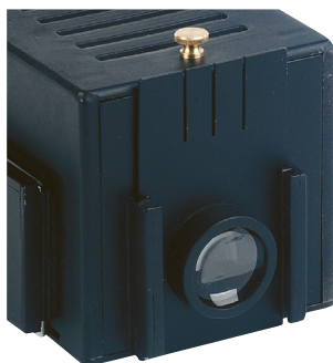
Fig.1 : Montage en configuration condenseur