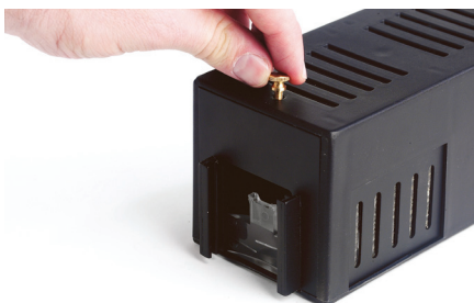
Fig. 5 : Solidarisation de la façade au boîtier