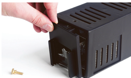
Fig. 4 : Montage de la façade