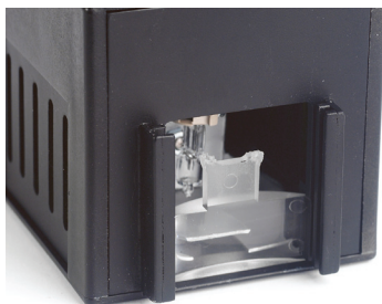
Fig. 6 : vue de face en configuration « rayons rasants »