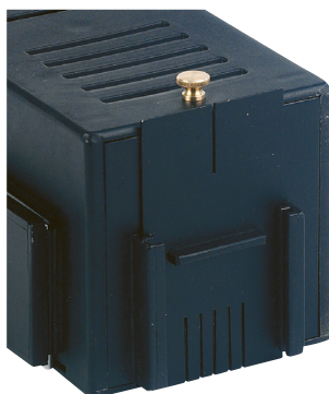
Fig. 2 : Montage en configuration « rayons rasants »