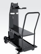
Carro ref. 041257